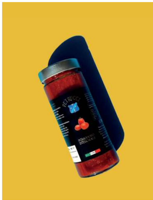
POMODORO INTEGRALE CONSERVA

POMODORI DATTERINI GIALLI, ARANCIONI & ROSSI.