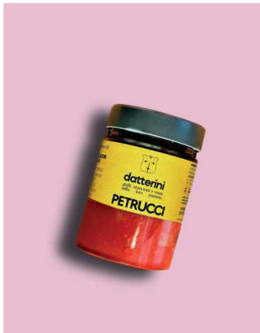
POMODORI DATTERINI & LA LORO PASSATA