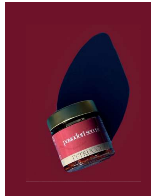
POMODORI SECCHI SOTT'OLIO EXTRAVERGINE