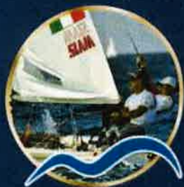
Marco Gradoni Medal Race Campionato del Mondo Assoluto 470, Luna Rossa Team